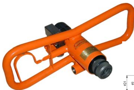
VHR 42/75.1 WK (с захватом)