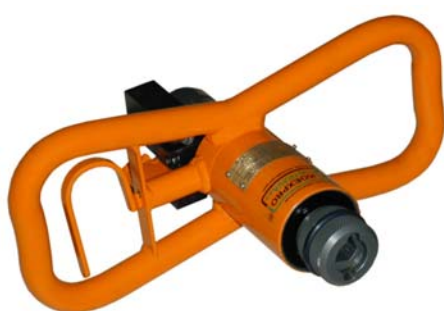
VHR 42/50.1 WK

Приводом дрели является специальный гидравлический двигатель, приспособленный для рабочего носителя – водной эмульсии HFA (мин. 1,5%). Гидравлическая схема управления позволяет регулировать обороты (крутящий момент) и предотвращает превышение установленного крутящего момента.